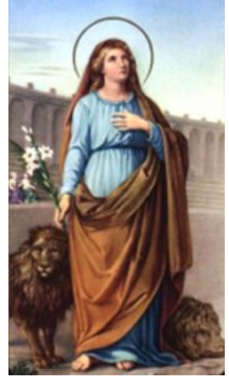
2. Św. Dominika