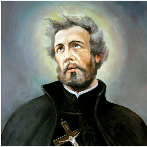
św. Andrzej Boboła

2. W liturgii tego tygodnia wspominamy: w środę NMP z Fatimy, w czwartek św. Macieja, a w sobotę św. Andrzeja Bobołę.