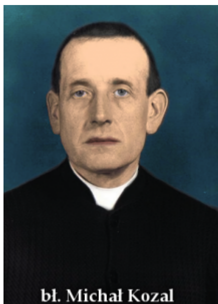
bl. Michał Kozal

1. Dzisiaj przeżywamy XI Niedzielę Zwykłą. Zapraszamy na nieszpory o 15:00. W Świerklach o 15:00 nabożeństwo fatimskie.