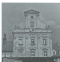
Po wyprowadzce Siostr Magdalenek w części budynku powstał sierociniec dla dzieci. Po II Wojnie Światowej w budynku klasztornym powstała też szpitalnica, internistyczne, sanatorium i dom starców. W roku 1923 kardynał Adolf Bertram odkupił budynek od państwa i założył tam placówkę „Caritas”. W klasztorze zamieszkały siostry Jachetanki i setka siostr. Siostry prowadziły też szkoły dla dziewcząt w zakresie prowadzenia domu, ogrodu i uprawy psów. Klasztor przetrwał nawałnicę II Wojny Światowej i pełni swoją funkcję do dziś. Ernst Mikulski

Zabudowania parafialne klasztoru stały pałace i popadały w ruinę. Plany ich przekształcenia opracowywano w Berlinie. Różni mieli być mający do wykorzystania nauczyliś inym razem zabudowania miały być przekształcone na więzienie. Były też plany przystrawienia zabudowań dla osób apokryficznych umiarko. Jednak z tych planów nic nie wyszło. Dopiero w roku 1813 w klasztorze uczątkono ziemię dla żołnierzy rosyjskich, rannych w bitwie pod Lipskiem. Po skądś rosyjskiego żołnierza pomieszczenia przekształcono w opiekę starożytności. Do opuszczonych pomieszczeń wprowadził się dzierżawca majątku i urządził w nich magazyn do przechowywania zboża. W roku 1869 państwo przejęło się klasztor, sprzedając go siostrze Magdalenie i Łubku. Siostry wyemigrowały klasztor za sumę 80 tys. marek i 7 czerwca 1870 aknowalowały się do Czarnowas. Jednak już wkrótce, w ramach tzw. „Kulturkampfu”, w 1879 musiały opuścić klasztor. Przewidy się do Holandi.