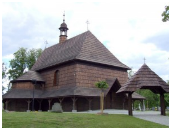
Kościół św. Anny w Czarnowasach

Już 19 sierpnia zapraszamy na kiermasz kościoła św. Anny.